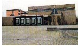
Christus unser Friede